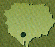
Haza Adrada de Haza

Distancia: 10,4 Km • Tiempo estimado: 2 h Desnivel acumulado: 116 m • Dificultad: baja Ciclabilidad: 100 % Época recomendada: todo el año Tipo de sendero: de ribera