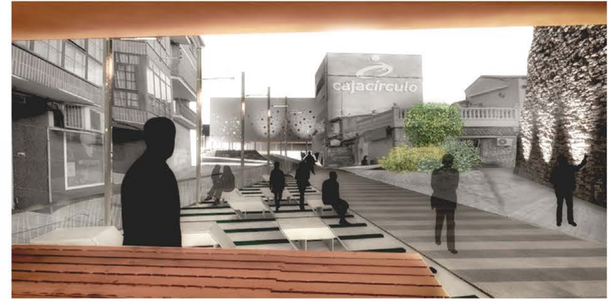
vista desde el quiosco

Crece en todo tipo de terrenos, pero necesita posiciones bien soleadas. Tiene una larga raíz central. Se debe plantar en su sitio definitivo lo antes posible. Lo ideal es en primavera, antes de que broten las yemas.