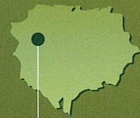
Olmedillo de Roa

Distancia: 8,4 Km • Tiempo estimado: 2 h Desnivel acumulado: 180 m • Dificultad: baja Ciclabilidad: 100 % Época recomendada: primavera, verano y otoño Tipo de sendero: de campiña