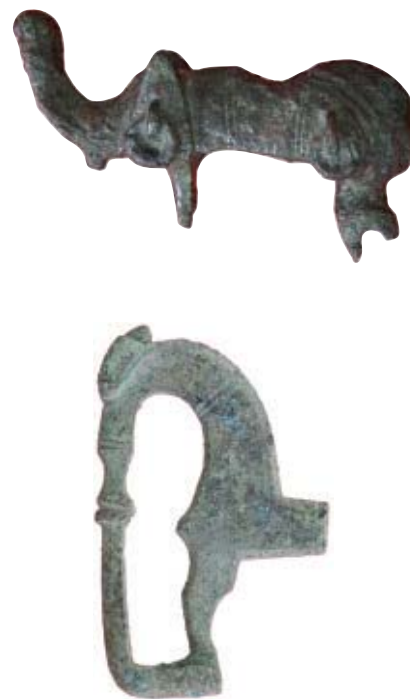
Fíbula de jabalí y fragmento de fíbula de caballito (ésta última procedente de un taller metalúrgico doméstico).

Por ahora no existe certeza plena sobre la ubicación de la o las necrópolis. De atender la noticia del P. Naval, es posible que una de ellas fuera destruida en el año 1908, cuando se extrajo tierra en el término de El Palacio (el lugar donde estuvo el desaparecido castillo medieval) para rellenar el hueco de la laguna de La Cava que entonces se desecó. Al parecer, existe también algún indicio de