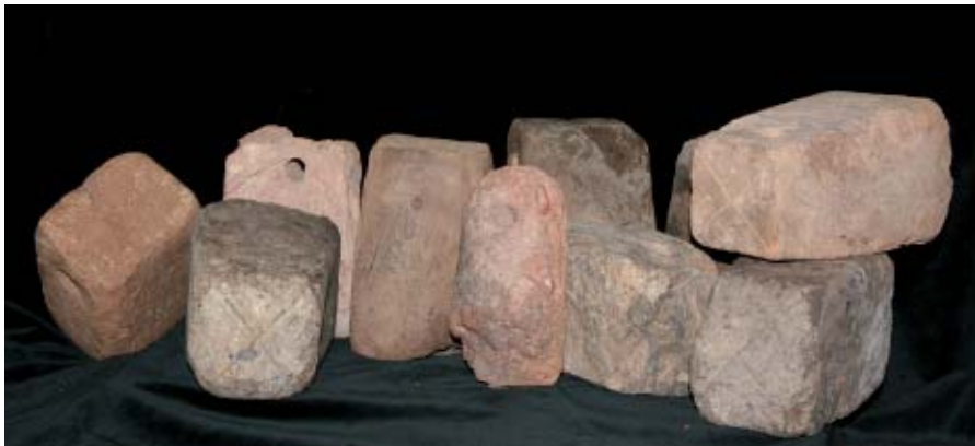
Pesas de telar de un solar de la calle Morería.

trípodes, las llamativas cajitas excisas, etc.