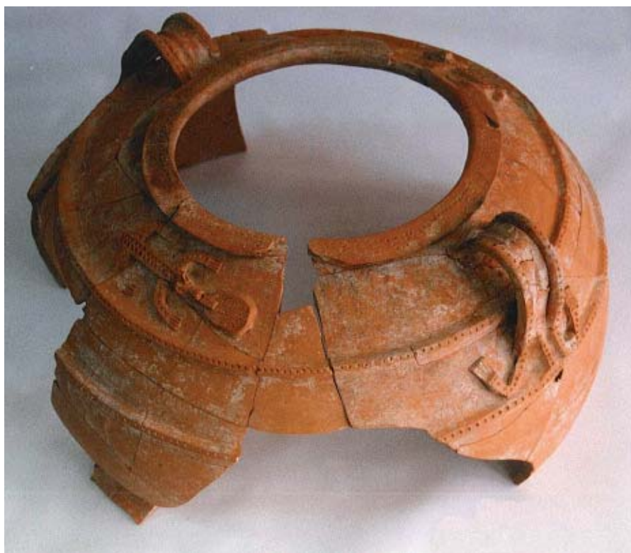
El vaso de los lobos (Eras de San Blas, Roa).

La población resurgida de la ruinas es mucho menos visible que la anterior, y apenas quedan testimonios fuera de un sector en torno a la Plaza Mayor. Ello puede deberse, en parte, a que los niveles de esta nueva población han sido los más expuestos a la destrucción por las obras posteriores, pero también refleja una mengua real. Hasta el momento, no han aparecido en Roa signos de construcciones edilicias o privadas de una mínima monumentalidad que diéran un marchamo romano al urbanismo indígena, ni documentos epigráficos u