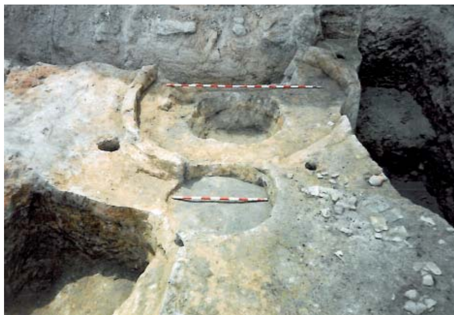
Calle de La Corredera. Vivienda circular de adobe con refuerzo exterior de postes, de la primera Edad del Hierro.

Rauda se situaba en el extremo sureste del territorio vacceo, en la orilla derecha del Duero, en un tramo donde el río describe una amplia vuelta hacia el