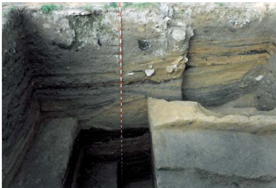
Excavación del foso del poblado del Hierro I, en la Calle de La Escuela.

la calle de la Escuela resultan muy expresivos de los cambios que entonces se operaron. Las cerámicas autóctonas seguían elaborándose sin ayuda del torno, pero se aprecian cambios en el repertorio que están por analizar. Están presentes, entre otros, los cuencos con decoración a peine, que ya antes aparecían muy esporádicamente, pero que ahora son mucho más numerosos, así como vasos de importación ibéricos torneados, que también con anterioridad se encontraban ocasionalmente en contextos del Primer Hierro al sur del Duero y que ahora llegan al norte del río. Un ambiente similar se ha documentado en solares de la calle de San Vicente nº 3 y de la plaza de la Alhóndiga y en el nivel fundacional del arrabal de las eras de San Blas.