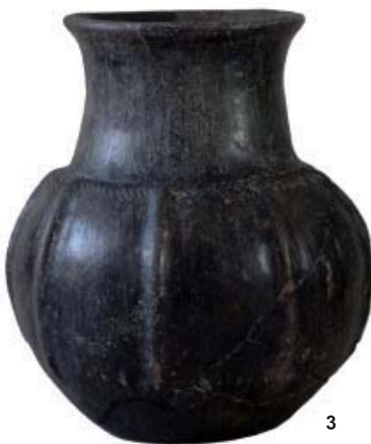
Cuenco con decoración de peine inciso-impreso de la Plaza de La Alhóndiga (1). Vaso trípode (2) y vaso gallonado de imitación metálica (3).

forme a un proyecto urbanístico. En el caso de Rauda , probablemente incorporaría, al menos, la población de los núcleos cercanos de San Martín de Rubiales y Hoyales de Roa; pero no conocemos la trama urbana antigua, oculta bajo el caserío moderno. Este proceso, que he explicado en otros lugares y que fue general entre vacceos y turmogos, se diferencia sensiblemente del que se produjo otras áreas de la meseta, en las que la colonización de tierras agrícolas y el aumento de la población dio lugar al surgimiento de numerosas aldeas nuevas dependientes de las nacientes ciudades. La mayoría de las ciudades de la cuenca sedimentaria carecieron de estos poblados satélites. Y tal fue el caso de Rauda , que se encontraba a una distancia de 22 kilómetros en línea recta del yacimiento vacceo más próximo, Pintia , que igualmente fue una ciudad-estado uninuclear. En una fase más avanzada del proceso, en la se-