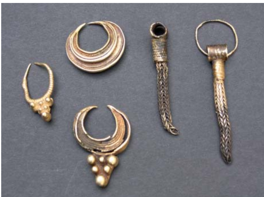
Joyas áureas del tesoro encontrado en la Plaza Mayor en 1947.

una posible necrópolis en un espacio situado al oeste de la población, entre las carreteras de Pedrosa de Duero y Mambrilla de Castrejón, donde, con motivo de las prospecciones que se efectuaron para la redacción de las Normas Urbanísticas Municipales, se notificó la aparición de lo que parecen restos de cremación y piedras calizas que podrían ser estelas o coraza protectora de las tumbas.